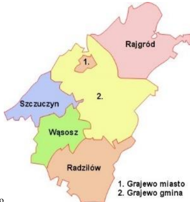
Mapa podziału powiatu grajewskiego

Powiat grajewski – powiat w Polsce (województwo podlaskie) utworzony w 1999 roku w ramach reformy administracyjnej.